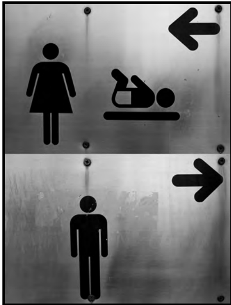
"Cambiamos o qué" 3er Premio - 2016

LIZARRAKO UDALEKO BERDINTASUN BATZORDEAREN XV. ARGAZKI LEHIAKETA