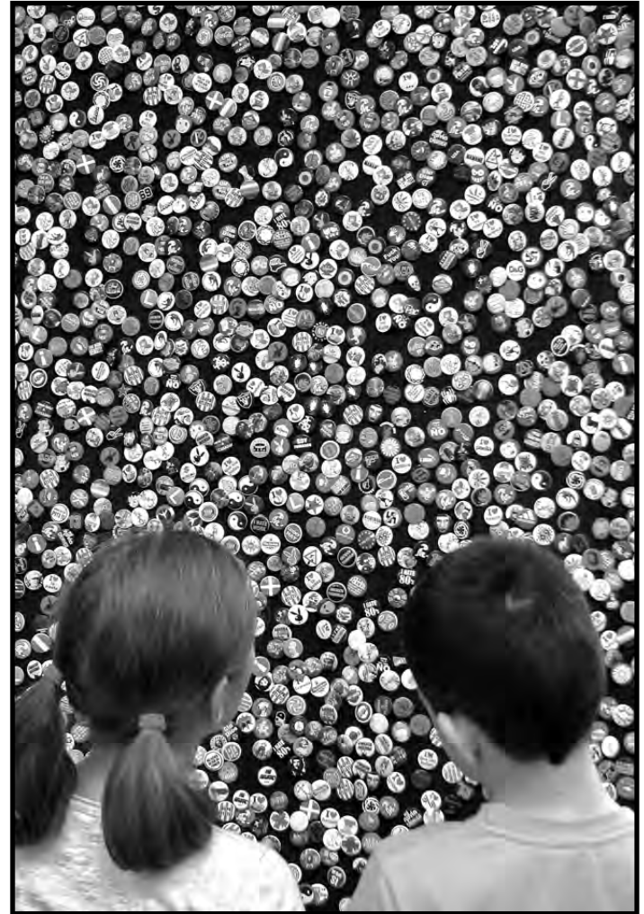
"Distintas opciones, mismas oportunidades" - 2º Premio - 2016