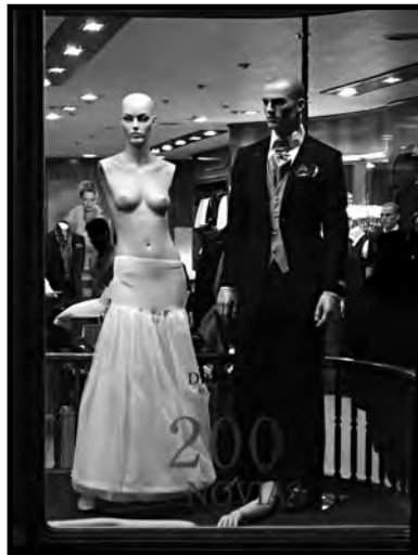
"El escaparate (alegoria)" Finalista 2016